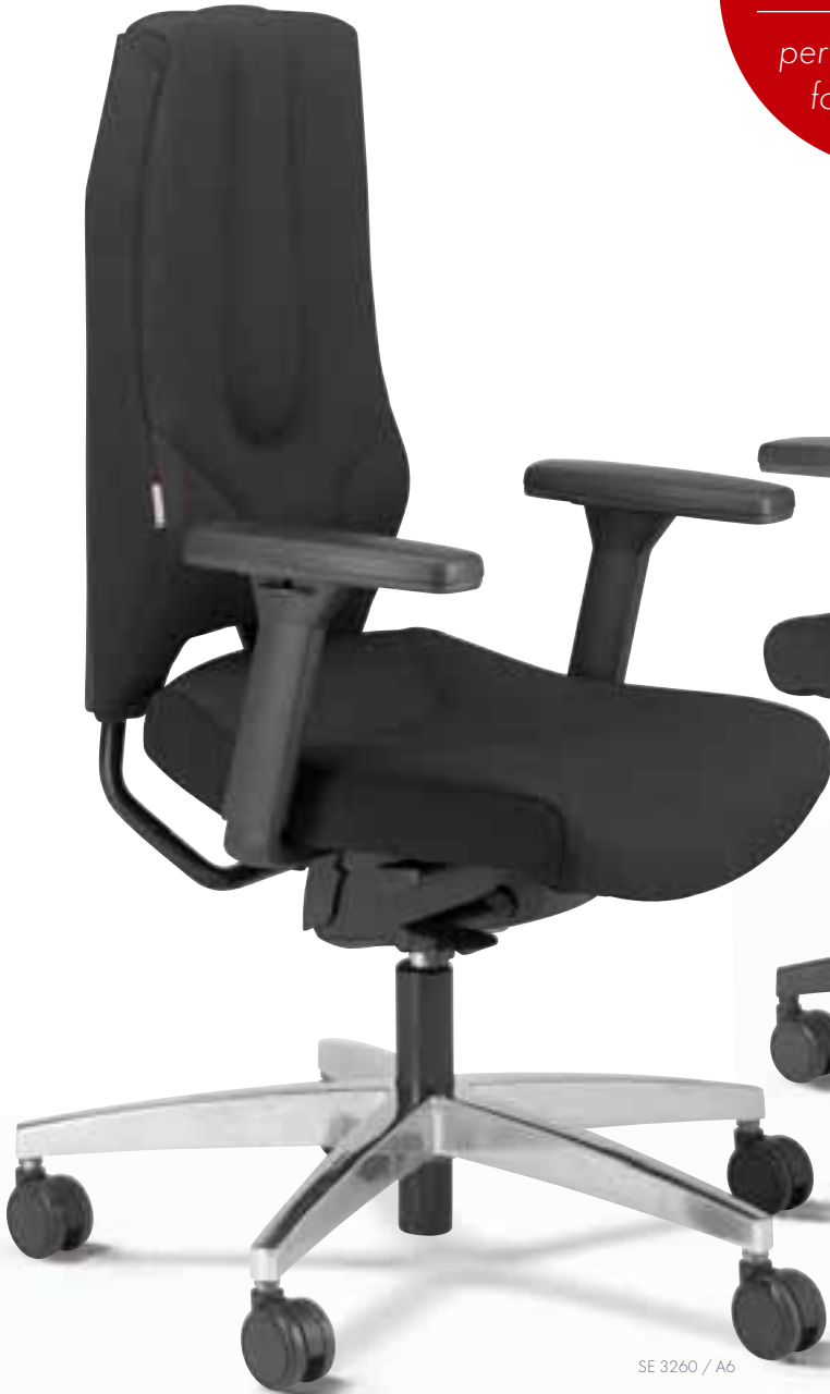
SE 3260 / A6