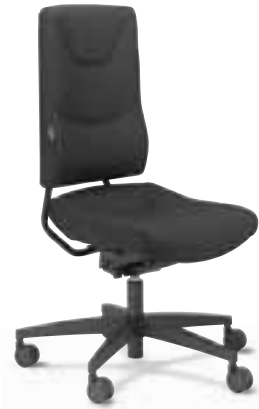
SE 2260 Synchron

Sitzneigung und -tiefe einstellbar adjustable seat tilt and depth