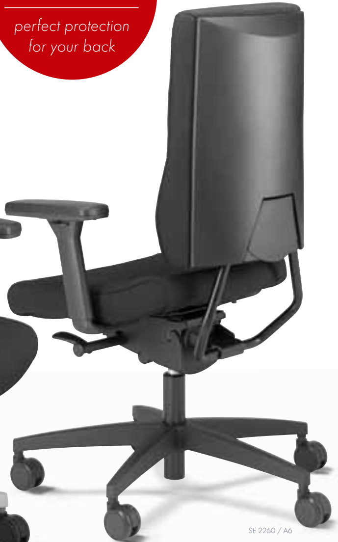
SE 2260 / A6