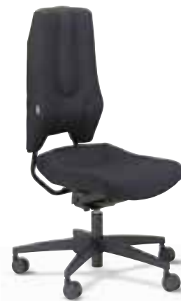
SE 3260 Synchron

Sitzneigung und -tiefe einstellbar adjustable seat tilt and depth