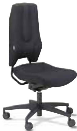
SE 3250 Synchron