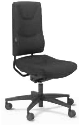
SE 2250 Synchron