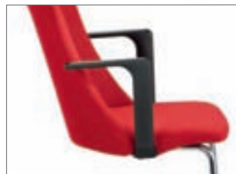
Armlehnen A6 offene Armlehne