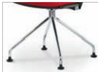
Gestell (RE 6xxx) 4-Fuß-Design