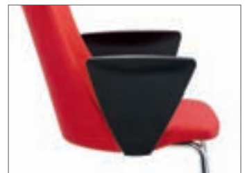
Armlehnen A7 geschlossene Armlehne