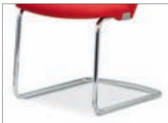
Gestell (RE 7xxx) Freischwinger